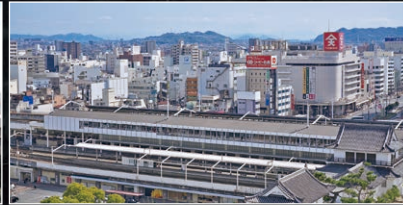
移動の起点となる福山の玄関口。買い物や飲食店などの商業施設も揃っています。