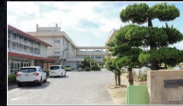
■福山市立光小学校 1,020~1,120m