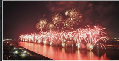
緑あふれる市民の憩いの場所。夏には大きな花火大会が開かれます。