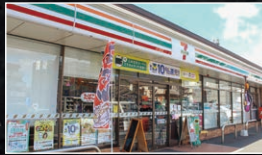
■セブンイレブン福山南本庄店 620~720m