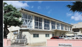
■福山市立鷹取中学校 650~750m