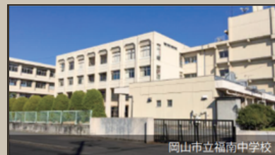
岡山市立福南中学校