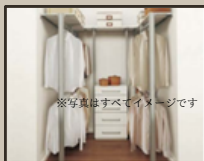
②家族の衣服がすっきり片付くファミリークローゼット