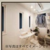
①水回りをまとめた家事動線

※こちらのプランの場合、建物本体価格の他に、インテリア工事費、外構工事費等が約200万必要です。