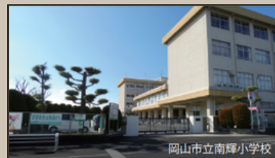
岡山市立南輝小学校