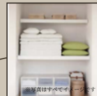
③たっぷり収納できます。広々2階収納、WIC

※掲載の建物プランは、お客様の参考としていただくための一例で、当プランを採用するか否かはお客様の自由です。※今回の分譲地ではセキスイハイム中四国にて施工を行うことが建築条件になりますが、プランにつきましてはお客様が自由にお決めいただくことが出来ます。※間取りに表示のある家具、調度品、植栽、自動車は価格に含まれません。