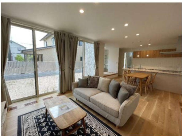
東出雲分譲住宅 撮影日2024/7/6