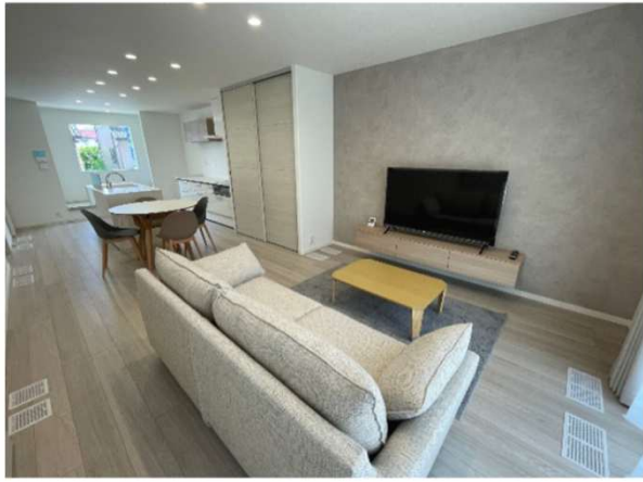
西津田3丁目分譲住宅 撮影日2024/6/27