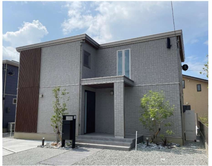
東出雲分譲住宅 撮影日2024/7/6