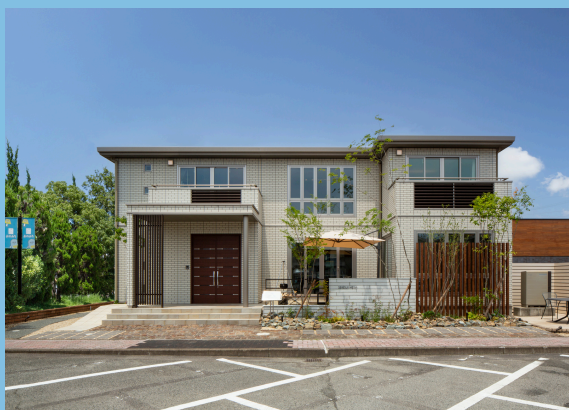
※実際の建物を撮影した写真です。(撮影日/2022年7月28日)