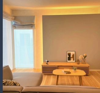
スマートハイムプレイス 水呑7号地分譲住宅 (2024年8月26日撮影)