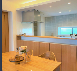
スマートハイムプレイス 水呑1号地分譲住宅 (2024年8月26日撮影)