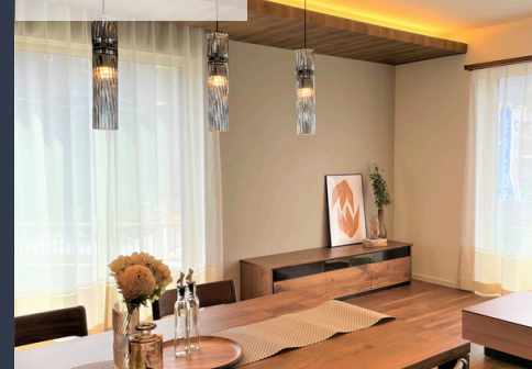
スマートハイムプレイス 水呑4号地分譲住宅（2024年4月5日撮影）