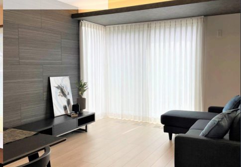
スマートハイムプレイス 水呑5号地分譲住宅（2024年4月5日撮影）