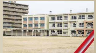
米子市立福米東小学校 <1,190~1,200m / 徒歩15分>