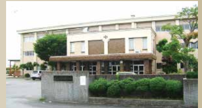
米子市立福米中学校 <1,790~1,800m / 徒歩23分>