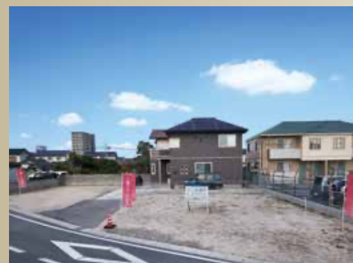
撮影年月日：2024年11月22日

【分譲地概要】●所在地/米子市米原7丁目225-19他 ●総区画数/3区画 ●今回販売区画数/2区画 ●交通/循環バス「北校入口」バス停 (250~260m/徒歩4分) ●地目/宅地 ●都市計画/市街化区域 ●用途地域/第一種住居地域 ●建ぺい率/60% ●容積率/200% ●道路の幅員/南東側8.0m(公道) ※私道負担なし ●主な設備/○電気:中国電力 ○ガス:個別プロパンガス ○水道:公営水道 ○雨水:側溝 ○汚水・雑排水:公共下水道 ●その他負担金/別途、水道加入者負担金37,400円(13mm)が必要です。 ●完成年月/2022年10月 ●取引態様/売主 ●建築条件付宅地分譲 ●備考/1号地への進入路については、2・3号地を購入された方の通行地役権が設定されます。