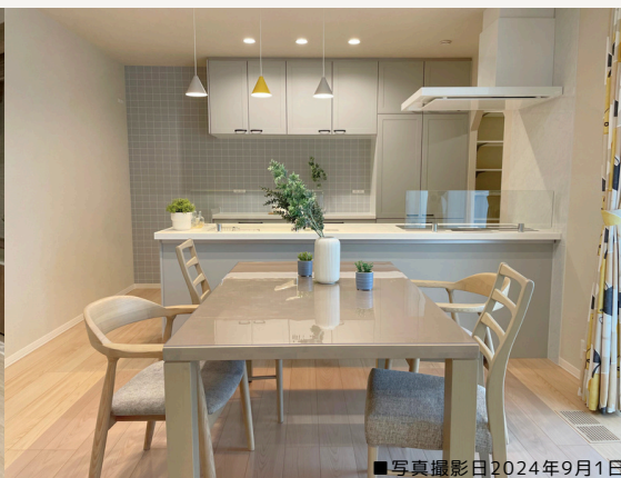
■写真撮影日2024年9月1日

トレンドのグレイッシュモダン × ブラックを合わせた大人な空間 書斎・ファミクロ・玄関洗面