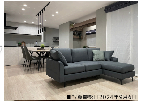
■写真撮影日2024年9月6日