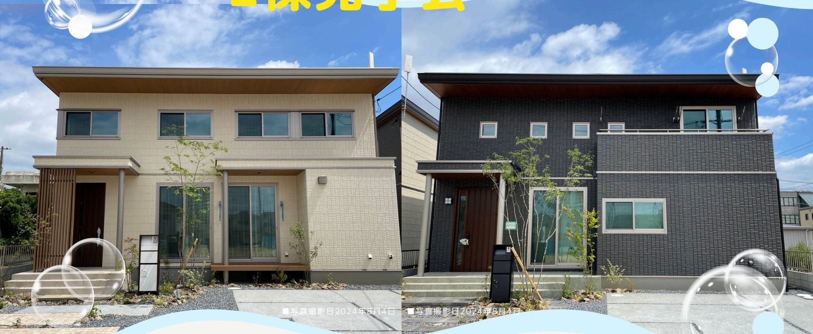
■写真撮影日2024年8月4日