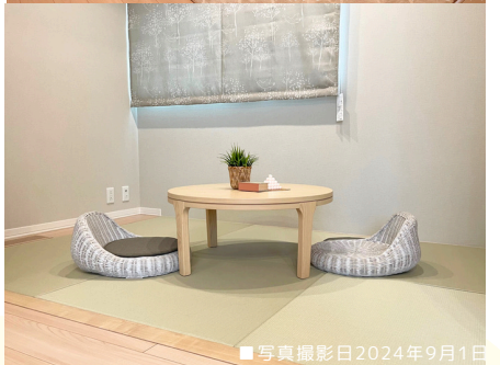
■写真撮影日2024年9月1日