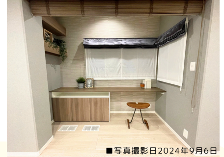
■写真撮影日2024年9月6日