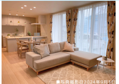
■写真撮影日2024年9月1日