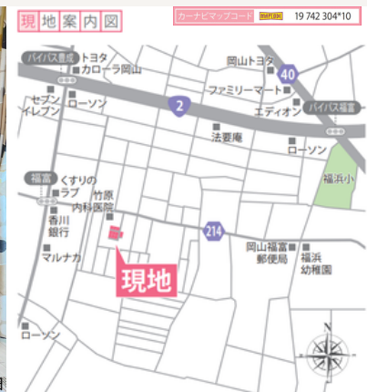
※「マップコード」および「MAPCODE」は（株）デンソーの登録商標です。 ※カーナビの機種によってはマップコードに対応していない場合があります。

気分の上がる明るい柔らかなカラーリング × 北欧ナチュラルテイスト 1F畳コーナー・パントリー・大容量WC