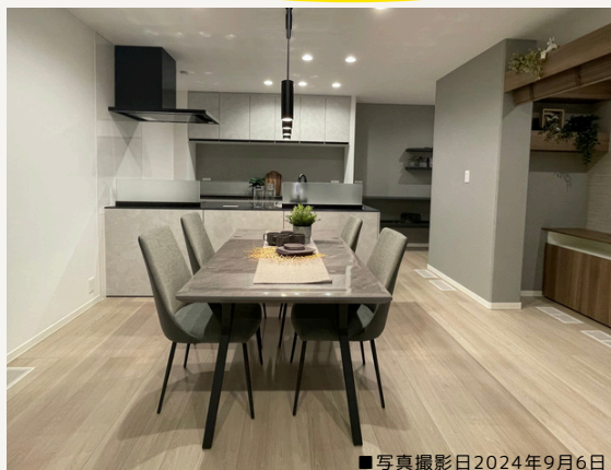
■写真撮影日2024年9月6日

トレンドのグレイッシュモダン × ブラックを合わせた大人な空間 書斎・ファミクロ・玄関洗面