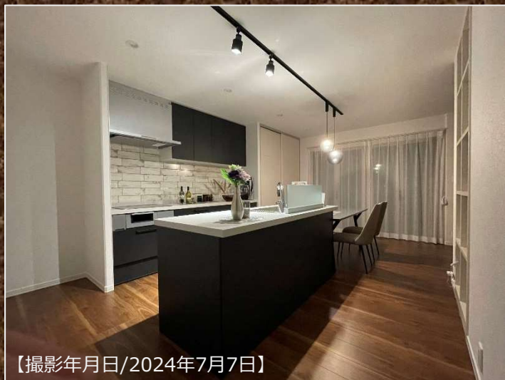
【撮影年月日/2024年7月7日】