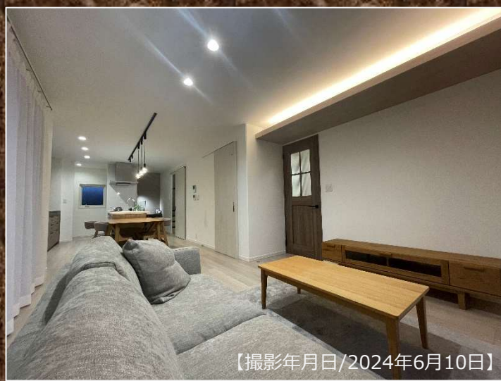
【撮影年月日/2024年6月10日】