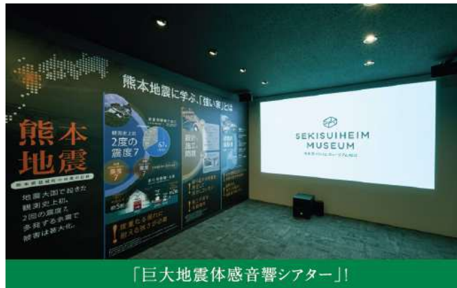
「巨大地震体感音響シアター」!