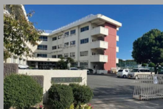
岡山市立旭竜小学校 徒歩6分～7分 (420～540m)