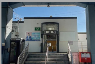
JR山陽本線・赤穂線「高島」駅 徒歩16分～17分 (1,210～1,290m)