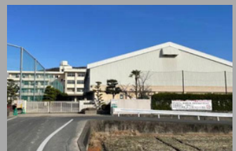
岡山市立高島中学校 徒歩25分～26分 (2,000～2,080m)