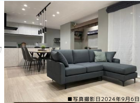
■写真撮影日2024年9月6日