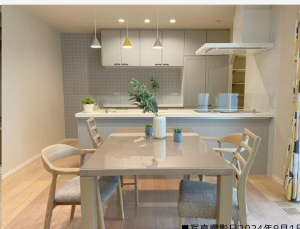
■写真撮影日2024年9月1日

トレンドのグレイッシュモダン × ブラックを合わせた大人な空間 書斎・ファミクロ・玄関洗面