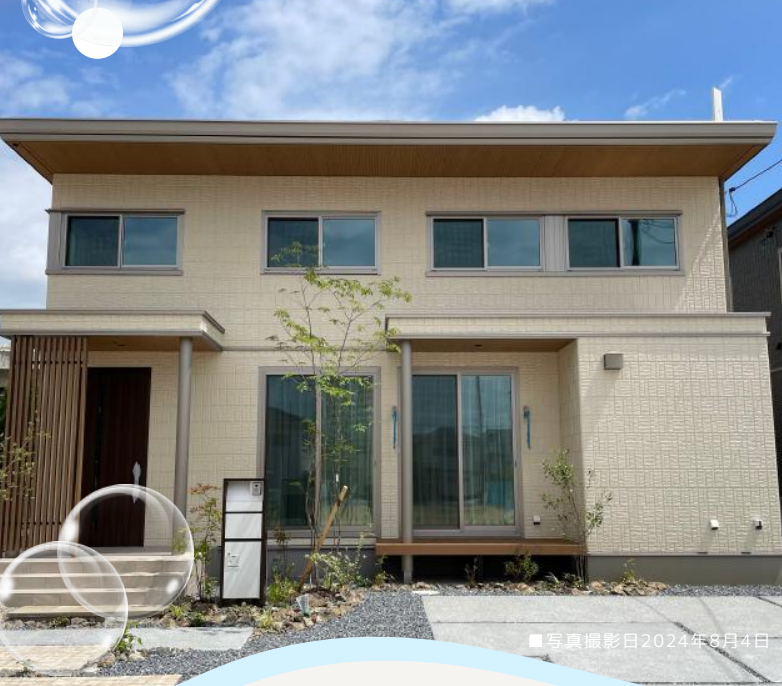
■写真撮影日2024年8月4日