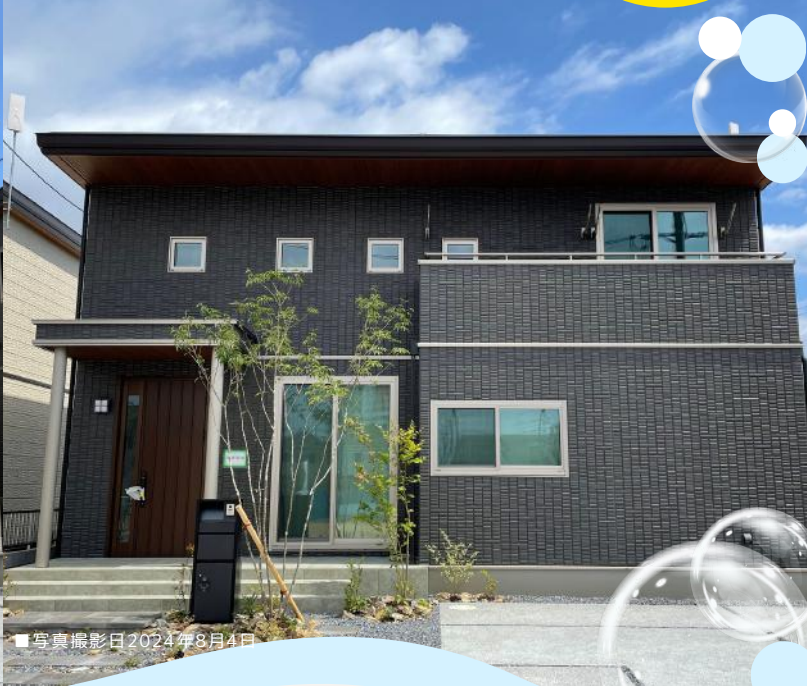
■写真撮影日2024年8月4日

ずっとお家で過ごしたくなる！ セキスイハイムのこだわりをいっぱい 詰め込んだお家、是非ご覧ください！