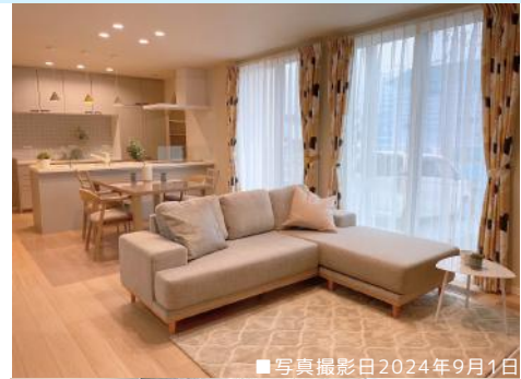
■写真撮影日2024年9月1日