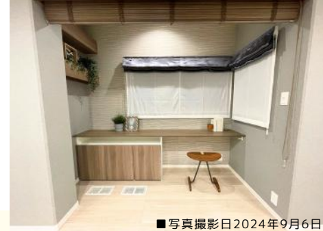
■写真撮影日2024年9月6日