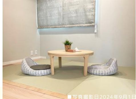
■写真撮影日2024年9月1日