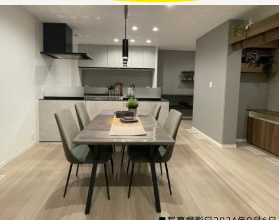
■写真撮影日2024年9月6日

トレンドのグレイッシュモダン × ブラックを合わせた大人な空間 書斎・ファミクロ・玄関洗面