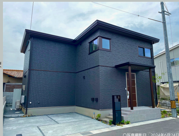
○写真撮影日: 2024年6月24日

◇掲載の情報は2024年6月30日時点の情報です。◇広告有効期限/2024年8月18日