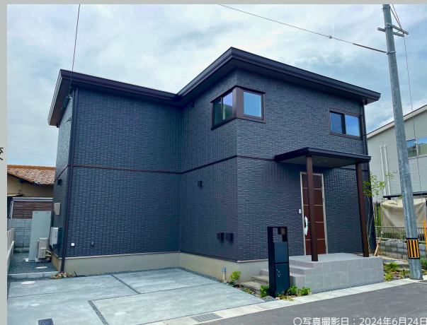
○写真撮影日: 2024年6月24日

◇掲載の情報は2024年6月30日時点の情報です。◇広告有効期限/2024年7月29日