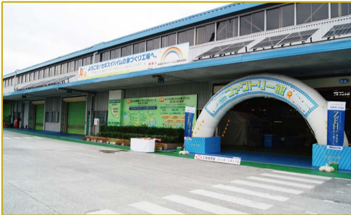
※写真は岡山工場のもになります。