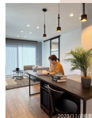
小上がりの畳スペース、2Fの広々書斎、日々の暮らしをちょっと贅沢に。