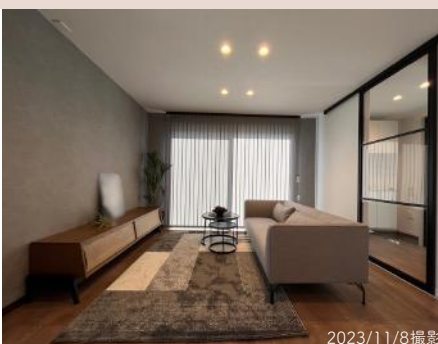
下がり天井のキッチンと透明なスライドウォール