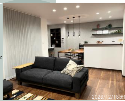
忙しい毎日の中でも、大きなお庭と大空間のLDKが家族の時間を作ります。