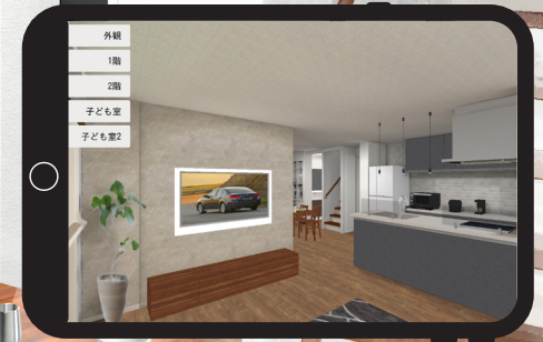
※イメージですので実際とは異なります