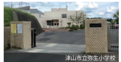
津山市立弥生小学校

【物件概要】 ●所在地/津山市小原字坪切72番24 ●建築確認番号/第ERI-23002570号 (令和5年1月25日) ●販売戸数/1戸 ●構造/軽量鉄骨造2階建 ●間取り/5LDK ●販売価格/37,800,000円 (消費税10%込) ●地目/宅地 ●都市計画/線引きされていない区域 ●用途地域/第二種中高層住居専用地域 ●建ぺい率/60% ●容積率/200% ●道路の幅員/分譲地内4.0m~6.0m (位置指定道路) ※津山市へ帰属予定 ●主な設備/○電気: 中国電力 ○ガス: 津山ガス ○水道: 公営水道 ○雨水: 側溝 ○排水: 公共下水道 ●建築年月日/2023年5月19日 ●取引態様/○建物: 売主 ○土地: 売主 ●備考/新設電柱の位置について買主は異議申し立てをしないこととします。○下水道受益者負担金は販売価格に含む。