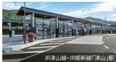
JR津山線・JR姫新線「津山」駅

●津山市立弥生小学校 (1,710m / 徒歩22分) ●津山市立北陵中学校 (1,620m / 徒歩21分)